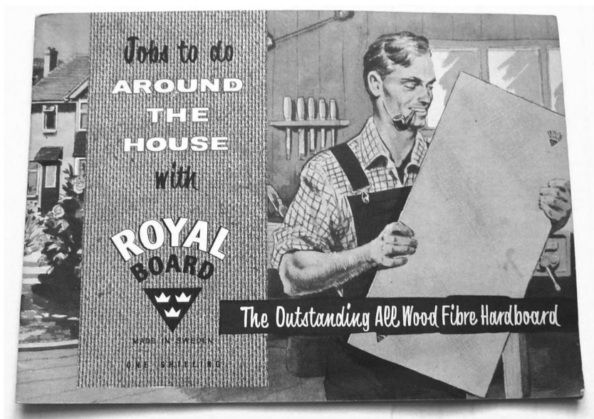
Рекламный щит фирмы Royal Board

странами Европы, такими как Великобритания, Голландия. Точно такой же штамп можно увидеть на рекламном щите фирмы 1940-х гг. (ил. 3). Наибольшее распространение продукция этой фирмы получила в 60–70-е гг. XX в. 7 Можно сделать вывод, что, скорее всего, в последней трети прошлого столетия шкаф подвергся реставрации, в результате чего его задняя стенка была изготовлена из оргалита.