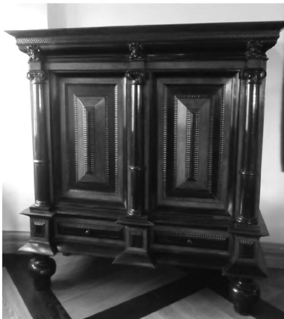
Голландский шкаф XVII века в экспозиции «Столовая изба» музея «Замковый комплекс «Мир»

Изготовление мебели в Голландии, как и в других европейских странах, считалось почётным занятием среди населения этой страны. Уже к началу XVII в. Амстердам стал одним из главных центров этого