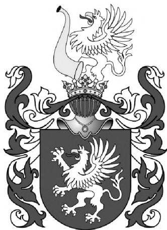
Герб Гриф в Гербовниках